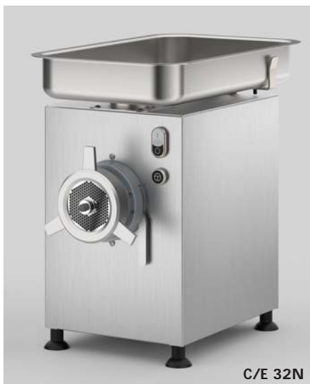
Tramoggia rimovibile - Removable feed pan - Abnehmbarer Einfüllschüssel - Trémie amovible - Tolla extraíble

The machine complies with CE standards in terms of hygiene and safety and with the specific standards for meat mincers.